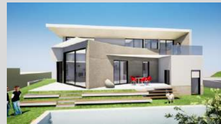
MAPA DE ACABAMENTOS